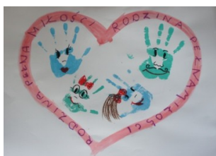
wyk. Alicja Sadowska; kl.5a; Zespół Szkół w Puchaczowie